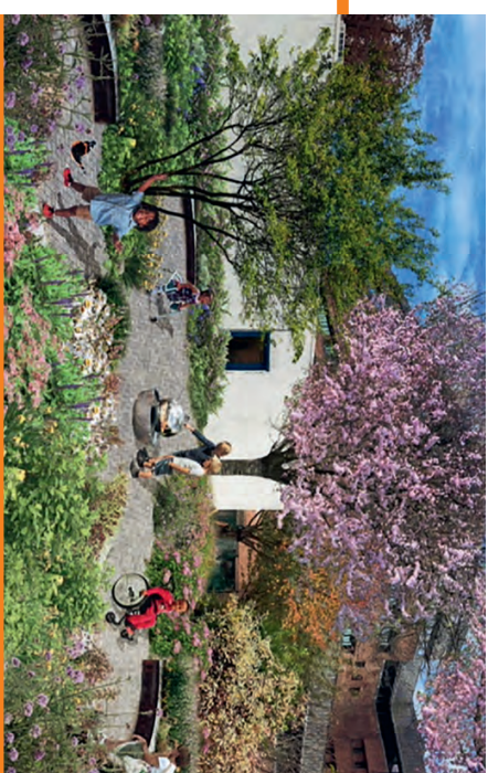
Vue du futur projet en construction